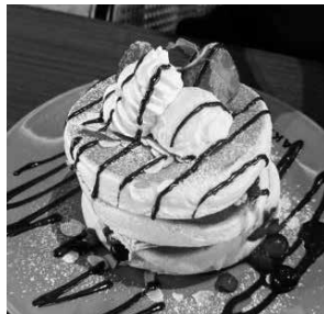
↑ 京田辺の高木珈琲