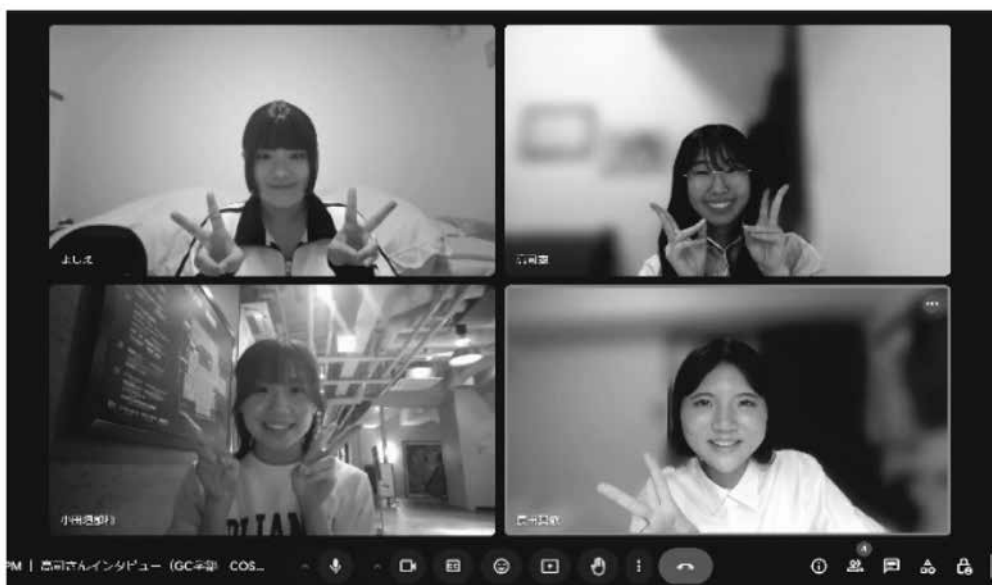
オンライン座談会での全体写真撮影