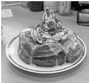
↑ 三山木のコメダ珈琲