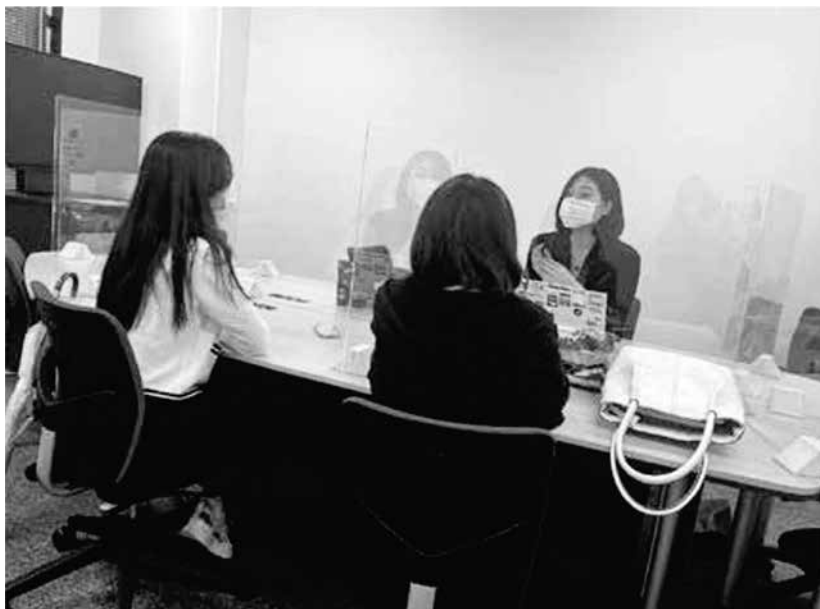
タンデム・パートナーの様子

タンデム学習を通じて、授業では学べない若者の言葉や自然な日本語の表現を学ぶことができ、関西弁にも少しずつなれていくことができました。また、週に1回の交流の中で、1週間の間に気になっていたことを話し合うことは、文化交流につながり、学業にも役立つと感じています。タンデムパートナーをきっかけに多くの友達を作ることもできる、多面的に学校生活にいい影響を与える制度です！